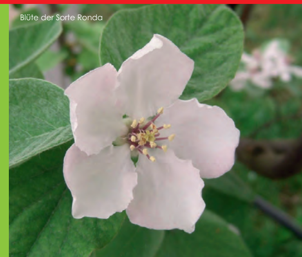
Blüte der Sorte Ronda