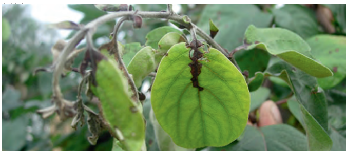
Bei solchen Blattverfärbung vom Blattstiel her besteht Feuerbrandverdacht. Dieser muss der örtlichen Feuerbrandkontrollstelle gemeldet werden. Mehr zu Feuerbrand unter www.feuerbrand.ch

Die noch lebenden, alten Quittenbäume in der Schweiz wurden bis heute bezüglich Sortenunterschiede noch nicht untersucht. FRUCTUS hat sich zum Ziel gesetzt, das zu ändern und startet 2017 in Zusammenarbeit mit dem Bundesamt für Landwirtschaft das Inventarisierungsprojekt Quitten.