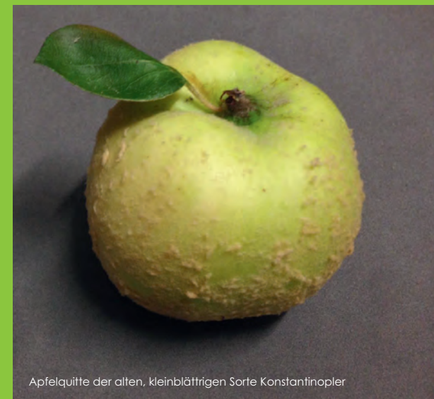
Apfelquitte der alten, kleinblättrigen Sorte Konstantinopler